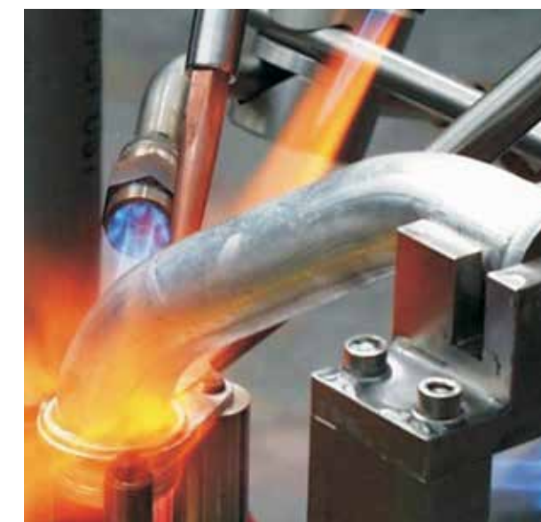
Mechanisiertes Spaltlöten mit automatischer Lotzufuhr

Beim Spaltlöten werden die Werkstücke so vorbereitet, dass zwischen den zu lötenen Bauteilen ein enger Kapillarspalt vorhanden ist. Der Spalt wird nach Erreichen der Arbeitstemperatur hauptsächlich durch den kapillaren Fülldruck des Lotes gefüllt. Diese Verfahrensvariante wird sowohl zum Handlöten, zum teilmechanisierten Löten als auch zum vollautomatischen Löten eingesetzt.