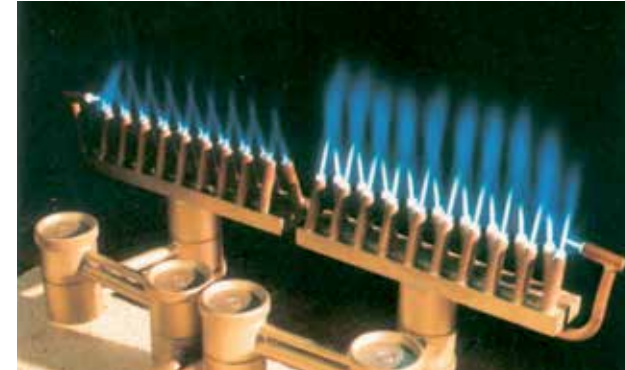
Lindoflamm® Sonderbrenner: Acetylen-Druckluft-Brenner

Für die Wärmezuführung zum Flammlöten eignen sich sowohl handelsübliche Schweißbrenner als auch Mehrflammen-Wärmebrenner. Einstelldrücke und Gasverbräuche sind in der für den Brennertyp gültigen Betriebsanleitung enthalten. In Form und Leistung angepasste Sonderbrenner (siehe auch Linde Prospekt LINDOFLAMM®) sind häufig zum automatisierten Flammlöten vorteilhaft.