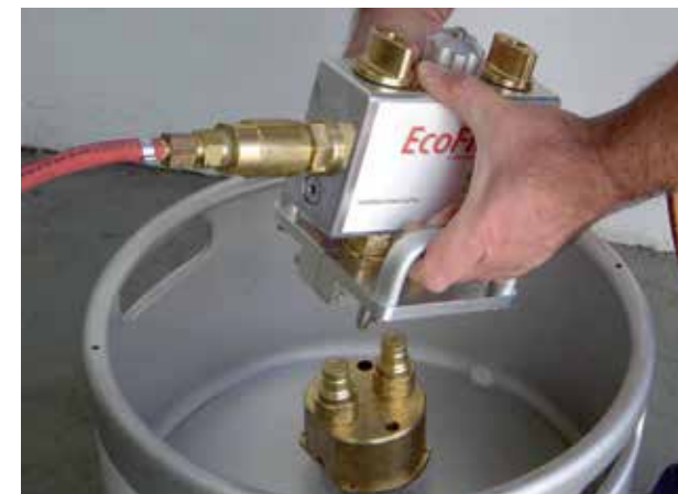
Ventilblock im Brenngasschlauch zum Anschließen an das Flussmittelgemisch

Als Gasflux werden gasförmige Flussmittel bezeichnet. Sie können nur beim Flammlöten eingesetzt werden. Der Brenngasstrom wird durch ein flüchtiges Flüssigkeitsgemisch geleitet und reichert sich dabei mit dem Flussmittel an. Das Flussmittel wird dann mit der Flamme auf das Bauteil befördert und entfernt dort die Oxide. Beim Spaltlöten muss für das Durchlöten zusätzlich ein Flussmittel zugegeben werden. Der Vorteil des Verfahrens liegt im optimalen Schutz der Lötstelle während des gesamten Lötprozesses und der leichten Entfernbarkeit der nicht korrosiven Rückstände mit Wasser.