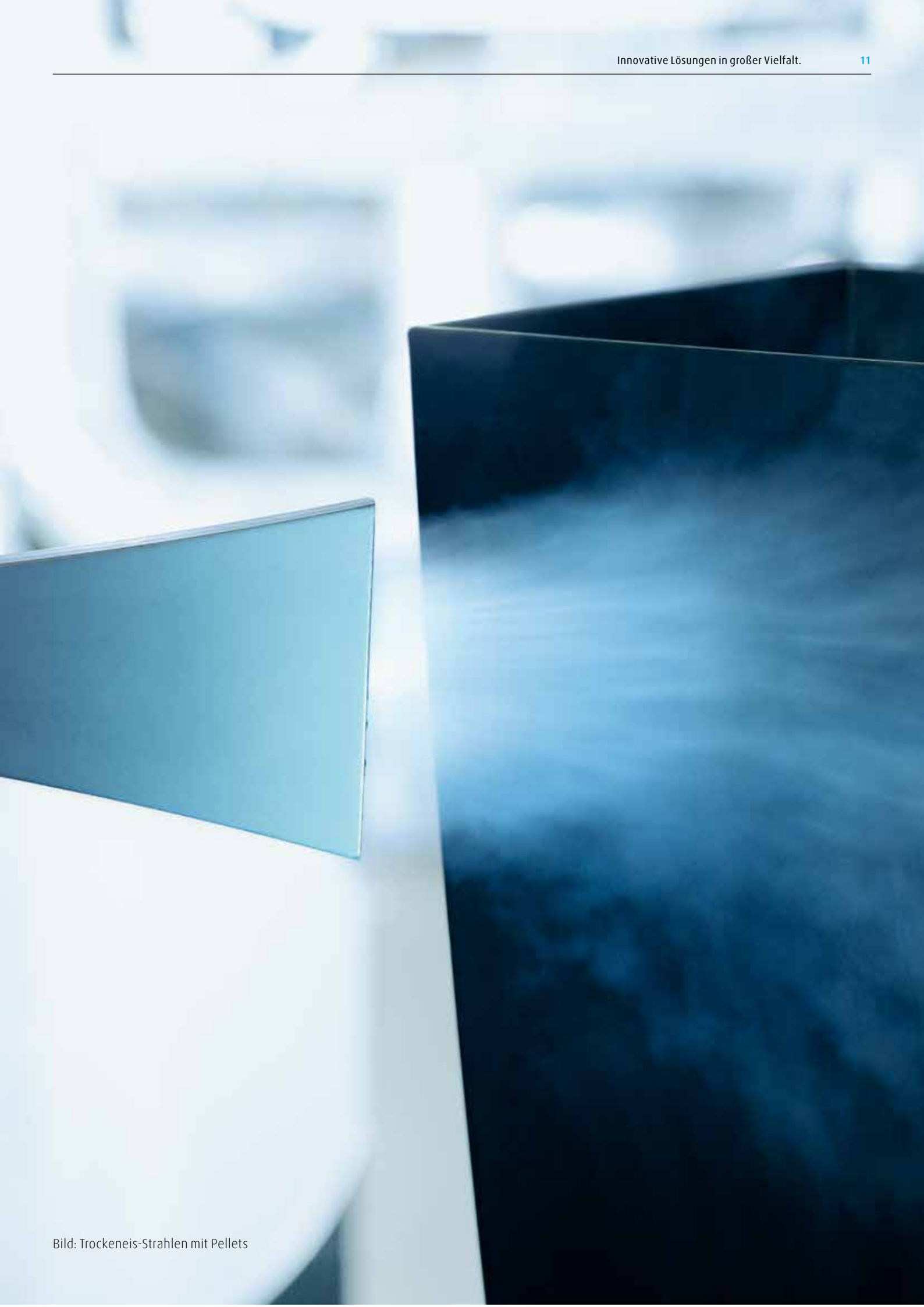
Bild: Trockeneis-Strahlen mit Pellets