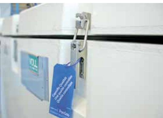
Geprüfte Qualität: Trockeneis geliefert in plombierten Roll- und Transportbehältern mit Herstellungsdatum.

Der Transport unseres Trockeneises erfolgt in geeigneten, gut isolierten, jedoch nicht dicht schließenden Behältern.