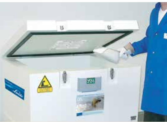
Warnhinweise bezüglich des sicheren Umgangs mit Trockeneis sind auf jedem Behälter angebracht.